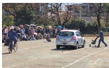
日本語学校生向け自転車安全教室／11月2日