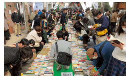
前橋ブックフェス2022／10月29日～30日