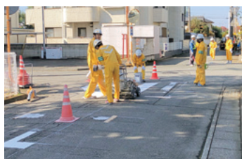
横断歩道白線引き／南町二丁目