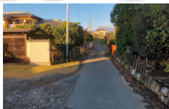
JA芳賀支所東の南北道路の拡幅工事決まる／鳥取町