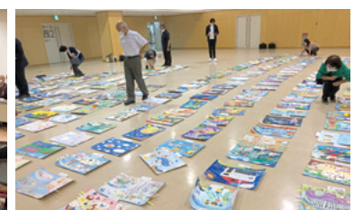
前橋ユネスコ協会絵画展の審査会／9月12日