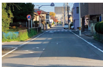
道路標識見えるように植栽剪定／南町四丁目