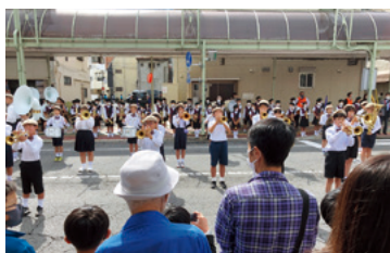
前橋まつり 城南小の鼓笛演奏／10月8日