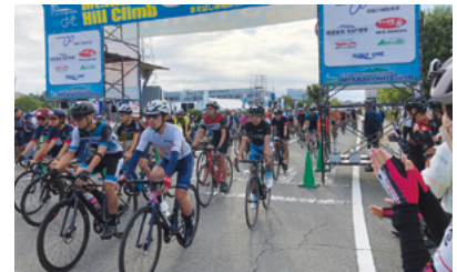
第12回まえばし赤城山ヒルクライム大会／9月25日