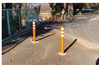
道路ポストコーン改修／南町二丁目