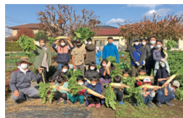
いも・大根掘り体験教室／11月26日