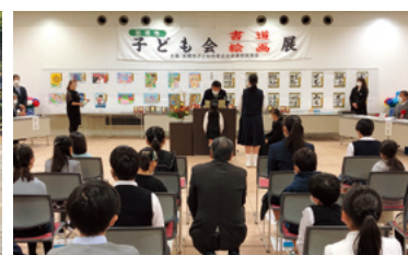
子ども会書画展表彰式／10月30日