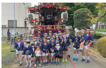
南町一丁目祭り山車出陣式／10月8日