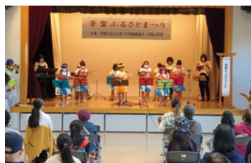
各地区で地区公民館文化祭開催／11月5日