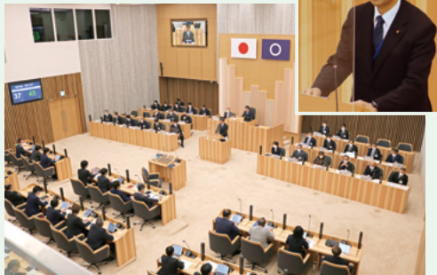
新議会庁舎で1番初めに総括質問