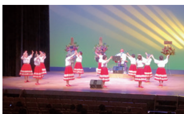
小暮哲朗50周年記念コンサート／12月9日