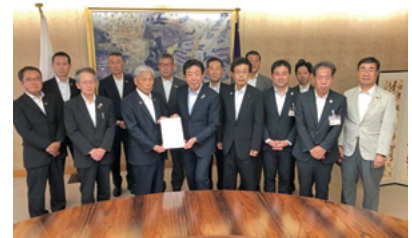
前橋市農業協同組合の市長要望に立会い／9月22日

昭和33年 慎一・ツヤの長男、前橋市南町生まれ 昭和49年 明星幼稚園・城南小・一中を卒業 昭和52年 群馬県立前橋高等学校卒業 昭和56年 宇都宮大学農学部農業経済学科卒業 昭和56年 前橋市役所入職(平成26年3月退職) 平成12年～ 明星幼稚園・城南小・一中の各PTA会長 平成13年 前橋市私立幼稚園協会PTA連合会長 平成14年 南町二丁目子供育成会会長(6年間) 平成14年 城南小地区子供育成会連絡協議会設立 平成21年 第1回一中ウオーケラリー創設開催 平成26年 一中昭和48年度卒同窓会「一同の会」代表幹事 平成27年 南町二丁目自治会副会長(4年間) 平成29年 前橋市議会議員に初当選 令和3年 前橋市議会議員に2回目当選 令和3年 総務常任委員会委員長 令和4年 前橋令明政策審議副会長