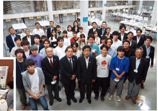
前橋工科大学学生との意見交換会／9月29日